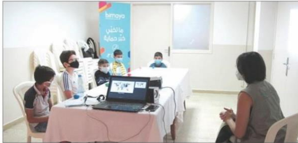
جلسة مع الصغار

في آذار ٢٠٢٠، مع بداية إنتشار فيروس كورونا توقفت كل نشاطات الجمعية بسبب الصعوبات المادية، وبعد الإلتزام بالحجر الصحي لمدة شهر تقريبا، قررت إدارة أيادينا اتخاذ إجراءات من أجل إعادة دعم المسنين عن طريق تغيير مسار عملنا بعض الشيء، فتوجهنا لجمع التبرعات المالية والعينية